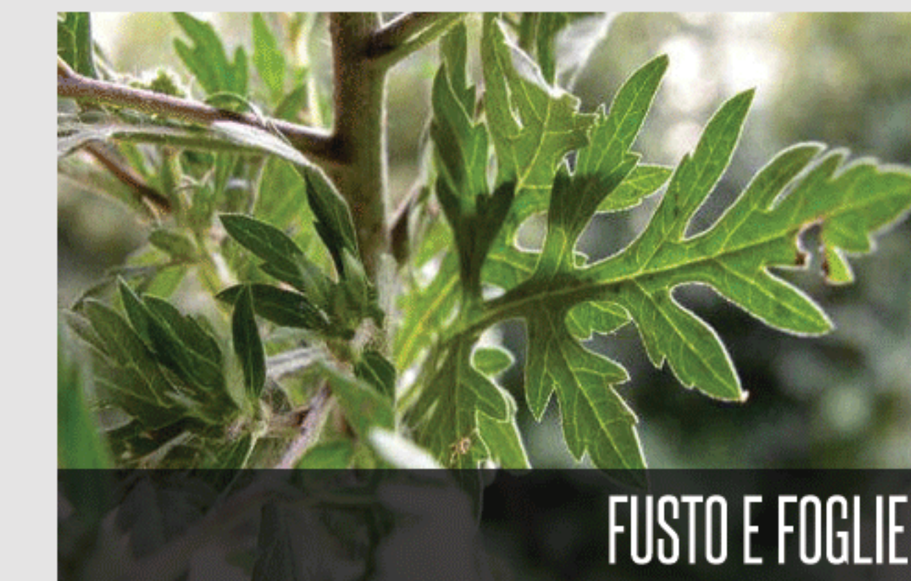
FUSTO E FOGLIE